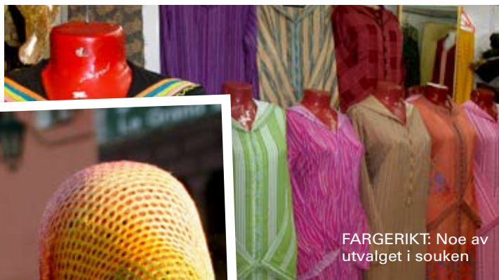
FARGERIKT: Noe av utvalget i souken