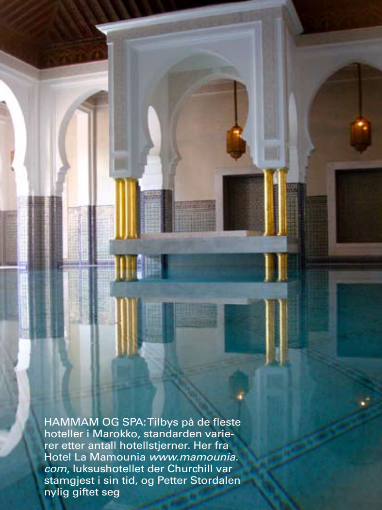
HAMMAM OG SPA: Tilbys på de fleste hoteller i Marokko, standarden varierer etter antall hotellstjerner. Her fra Hotel La Mamounia www.mamounia.com , luksushotellet der Churchill var stamgjest i sin tid, og Petter Stordalen nylig giftet seg