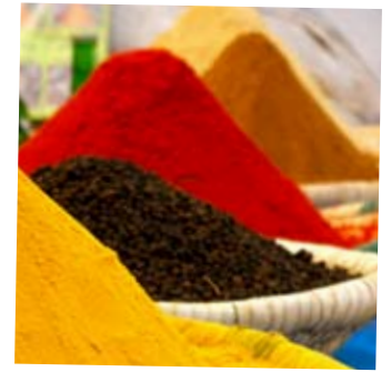
KRYDDER: I bøtter og spann.

I souken i gamlebyen er det mye lekkert å få kjøpt: orientalske tepper, sko, vesker, belter, puffer, lamper og tekstiler for å nevne noe. Ta med cash og mye tålmodighet – å handle i Marrakech innebærer ofte tedrinking og historiefortelling. I den nye bydelen Guéliz er det mange shopingsentra med vestlige butikker og faste priser.