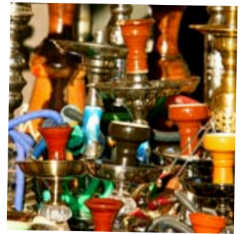
FRISTELSER: Skal det være en vannpipe?