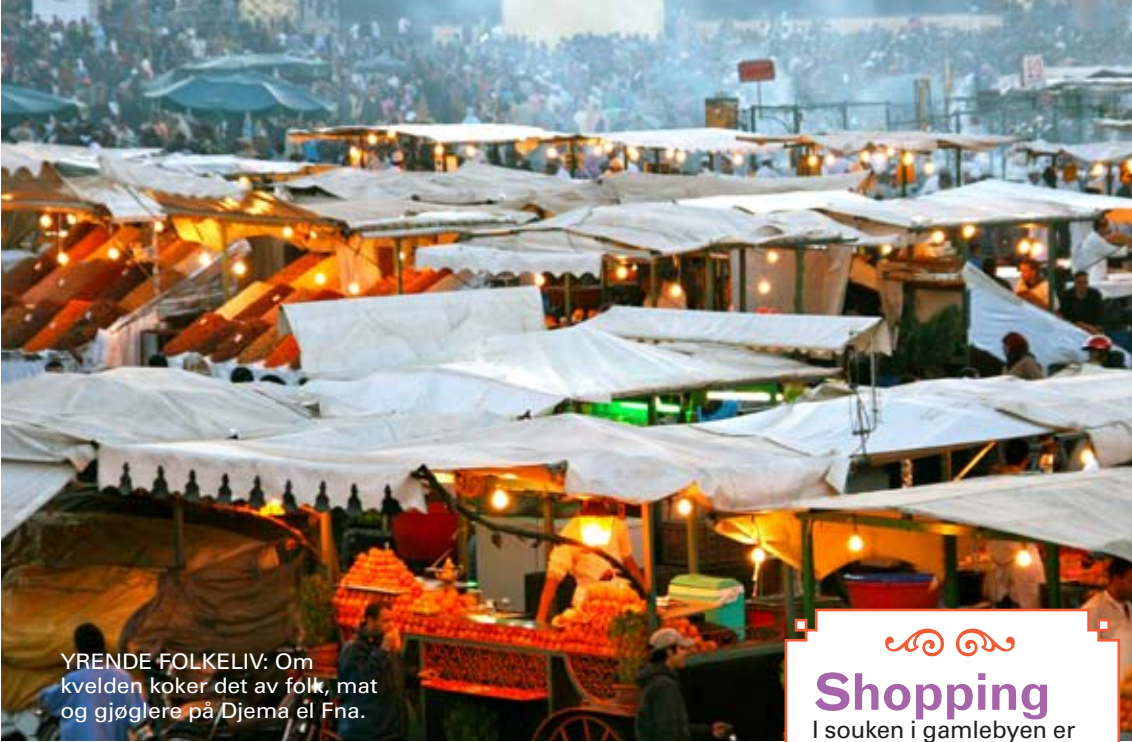
YRENDE FOLKELIV: Om kvelden koker det av folk, mat og gjøglere på Djema el Fna.