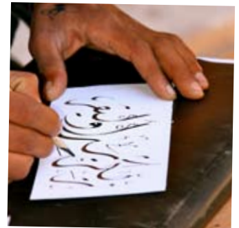
KALLIGRAFI: få navnet ditt med arabiske bokstavene