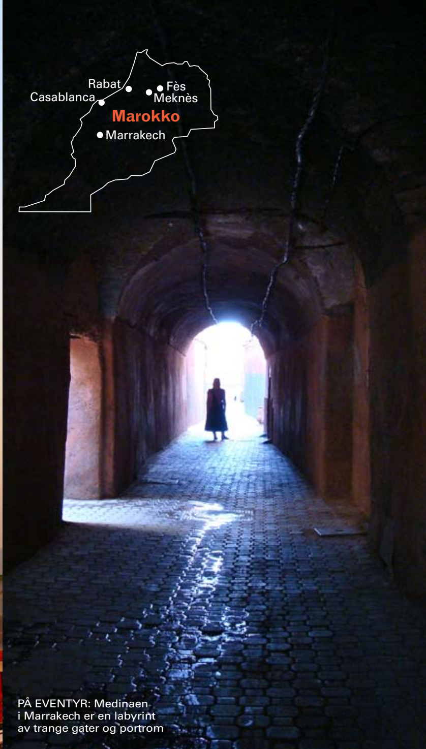
PÅ EVENTYR: Medinaen i Marrakech er en labyrint av trange gater og portrom

D jema el Fna, gjøglernes torg. Om kvelden et yrende folkeliv. Musikk og historiefortellere, tryllekunstnere, slangetemmere og restaurantboder om hverandre. Denne morgenen ligger den store plassen helt stille og alene, som et øde landskap. Gatefeiere vasker vekk festen og matrestene fra i går. Noen spylar og koster bakken, mens andre skrubber den med såpe og vann.