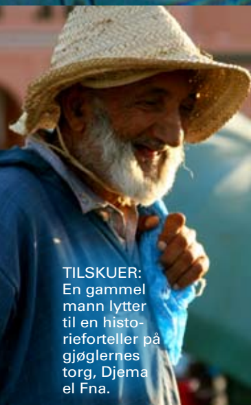
TILSKUER: En gammel mann lytter til en historieforteller på gjøglernes torg, Djema el Fna.

Obs: Det er adskilte hammamer for menn og kvinner.