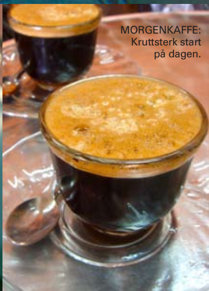
MORGENKAFFE: Kruttsterk start på dagen.