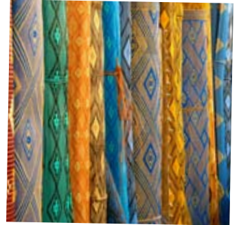
MYE Å VELGE I: Ruller med lekre stoffer.