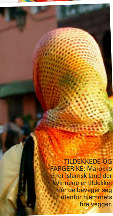
TILDEKKEDE OG FARGERIKE: Marokko er et islamsk land der kvinnene er tildekket når de beveger seg utenfor hjemmets fire vegger.