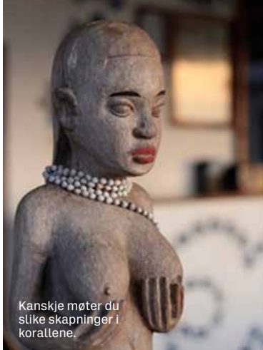
Kanskje møter du slike skapninger i korallene.