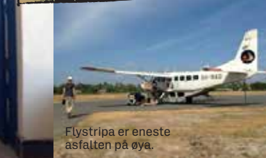
Flystripa er eneste asfalten på øya.