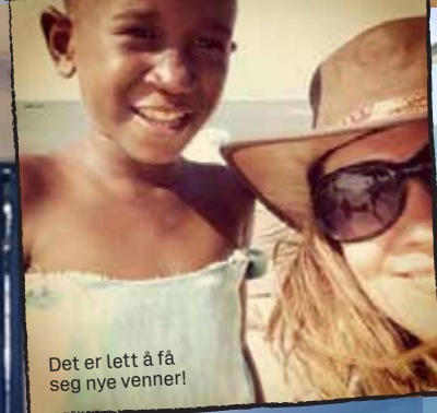
Det er lett å få seg nye venner!