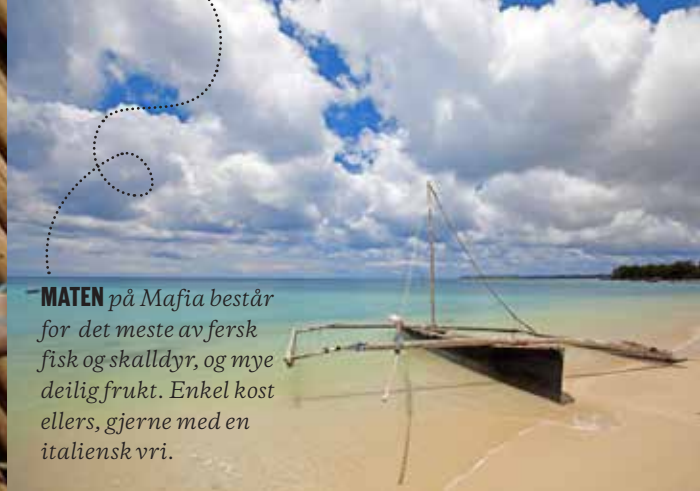
På Mafia lever de fleste av fiske.

MATEN på Mafia består for det meste av fersk fisk og skalldyr, og mye deilig frukt. Enkel kost ellers, gjerne med en italiensk vri.