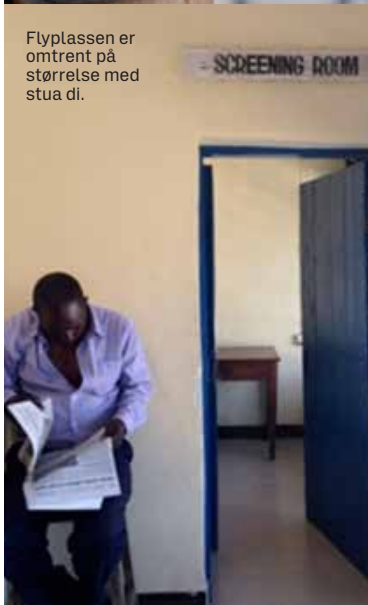
Flyplassen er omtrent på størrelse med stua di.

MATEN på Mafia består for det meste av fersk fisk og skalldyr, og mye deilig frukt. Enkel kost ellers, gjerne med en italiensk vri.