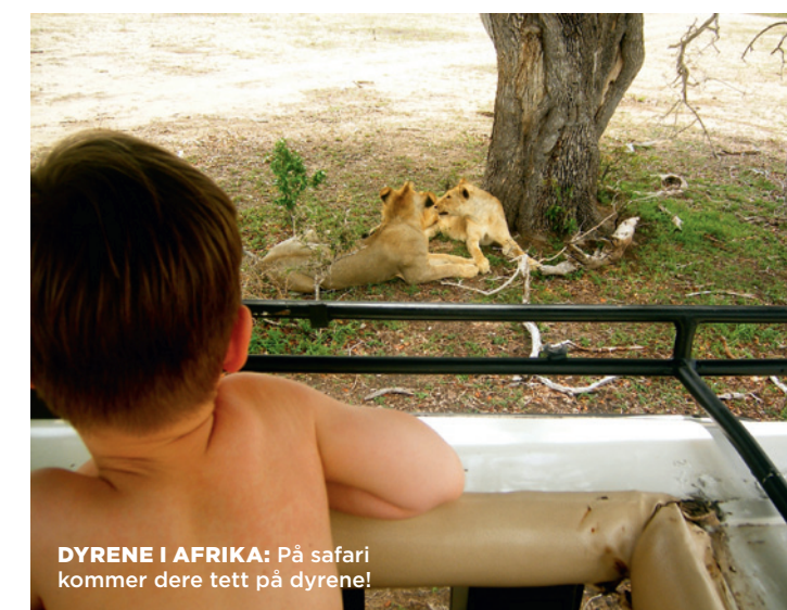
DYRENE I AFRIKA: På safari kommer dere tett på dyrene!

DET ER TØRKETID NÅ, noe landskapet bærer preg av. Gule sletter, nakne trær og her og der dyrekadavre og skjeletter. Den lange regntiden skal snart skylle etterlengtet innover den knusktørre savannen, fylle elv og vannhull og gjøre de afrikanske