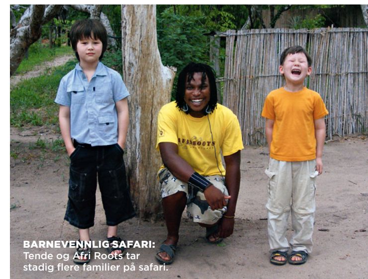
BARNEVENNLIG SAFARI: Tende og Afri Roots tar stadig flere familier på safari.