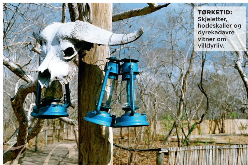
TØRKETID: Skjeletter, hodeskaller og dyrekadavre vitner om villdyrliv.

★ I TILLEGG TIL SAFARI: Bygge sandslott på de pudderhvite strendene eller dykke og snorkle i det turkisblå og krystallklare Indiske hav på Zanzibar, Pemba eller Mafia.