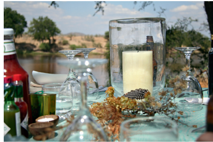
BUSHMIDDAG: Treretters middag servert midt i villmarken.