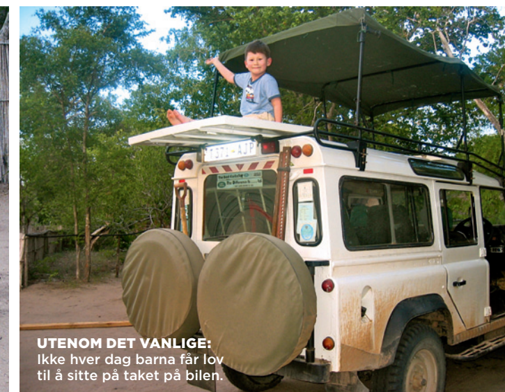
UTENOM DET VANLIGE: Ikke hver dag barna får lov til å sitte på taket på bilen.

pannekaker til frokost og spaghetti til middag. Selv er han utrustet med en stor porsjon tålmodighet. Når barna bombarderer med spørsmål svarer han klokt og alltid med et smil.