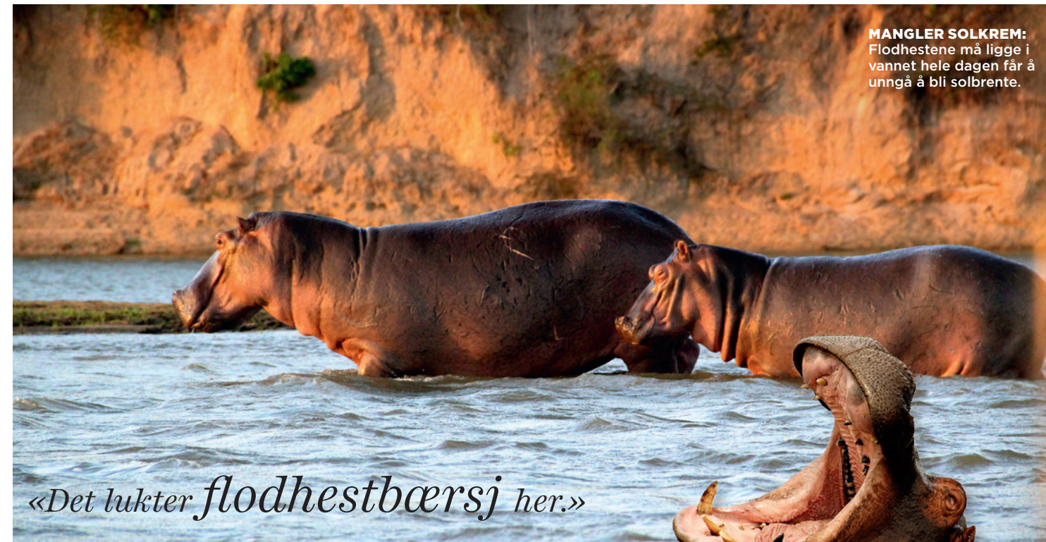
MANGLER SOLKREM: Flodhestene må ligge i vannet hele dagen får å unngå å bli solbrente.